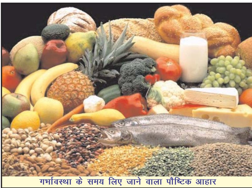
गर्भावस्था के समय लिए जाने वाला पौष्टिक आहार

कई बार महिला माँ बनने वाली है इस बात का पता परिवार के अन्य सदस्यों को 2-3 महीने बाद पता चलता है। ज्यादातर ऐसा संकोच के कारण होता है। ये 2-3 महीने जिसमें देखभाल की ज्यादा जरूरत होती है वो तो बिना किसी देखभाल के सिर्फ